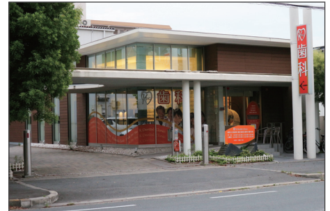
2013年に開業。清潔感のある設備や親切な診療対応が、口コミなどでも好評を得ている

吹田市の江坂エリアで地域に根差した診療を行っている歯科クリニック。歯科医療を通じた社会貢献を目指して、お客様のあらゆるニーズに応えるべく、院長をはじめスタッフ一同努力されています。 URL: http://www.k-dc.me/