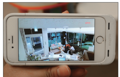
受付後方に設置したカメラの映像。スマホで入口から受付、待合室まで全体を見渡せる

360度自動追尾カメラを導入したことで、当医院の防犯は確実にアップしました。同時に、（見守りの安心感でしょうか）待合室のお客様からもカメラ設置について良いお声をいただきます。当医院の印象も確実にアップしましたね。